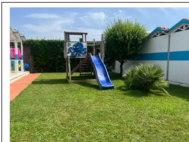
Area giochi per bambini